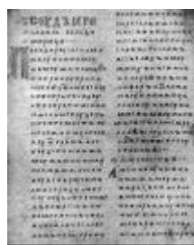
Двинская уставная грамота

Лихоимец – жадный вымогатель, взяточник».